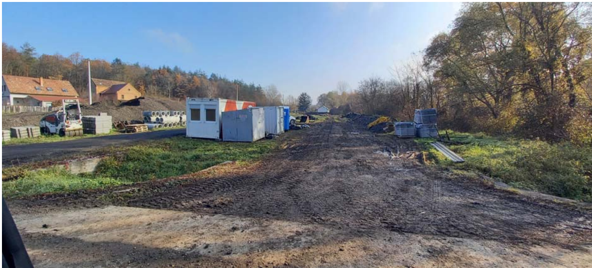
Fotó a telek jelenlegi állapotáról

Az épület tájbaillesztését a HÉSZ Gip-1 építési övezetre vonatkozó növényesítési előírása (az építési telkek oldalsó és hátsó telekhatára mellett, attól min. 1,5 m-es távolságra legalább 1 sor, szaktervező által kiválasztott fajokból álló védőfásítás telepítendő és tartandó fenn), valamint a tervezett anyaghasználat (szendvics-szerkezetű falak külső faburkolattal, cserép tetőfedő anyag) biztosítja.