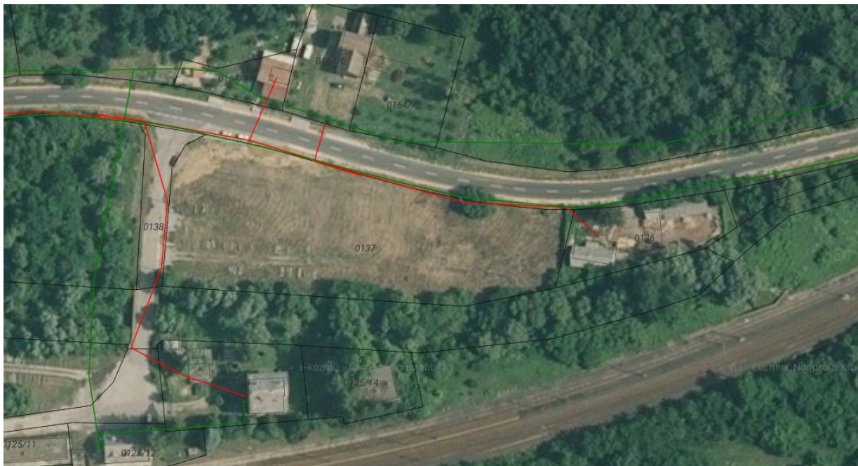
E-közmű térkép kivágata ortofotóval